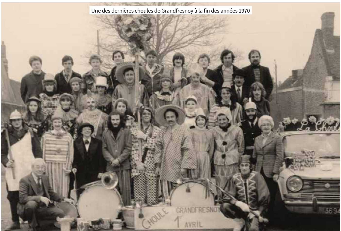
Une des dernières choules de Grandfresnoy à la fin des années 1970

Pourtant, sous une forme plus policée, elle connaît ces dernières années un regain d'intérêt de la part des nouvelles générations dans certaines communes de l'Oise comme, par exemple, à Tricot.