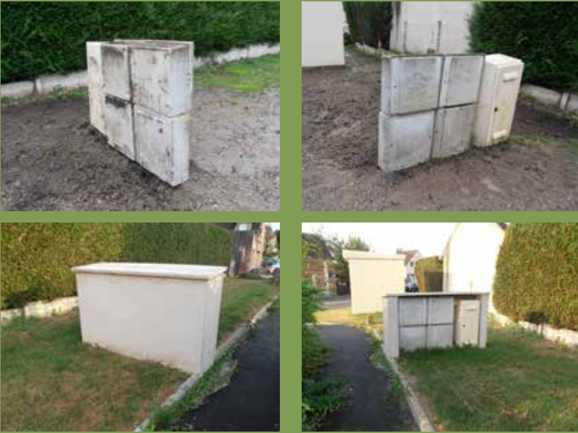
COMPTEUR RUE PUISSOT