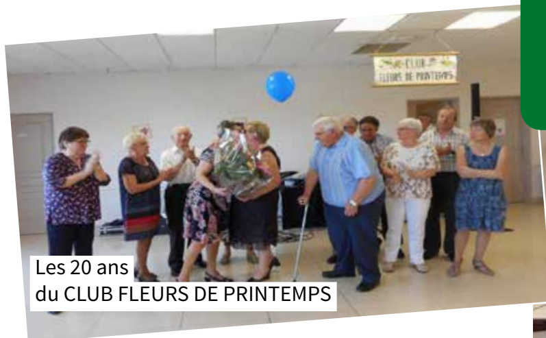
Les 20 ans du CLUB FLEURS DE PRINTEMPS