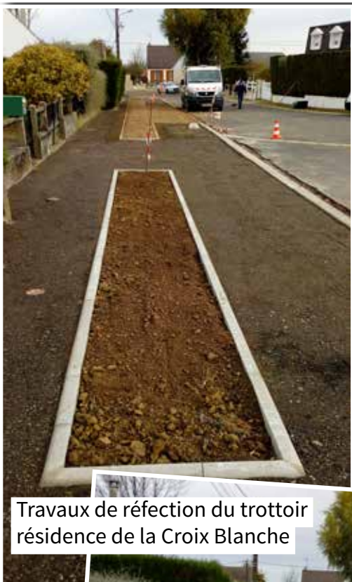
Travaux de réfection du trottoir résidence de la Croix Blanche