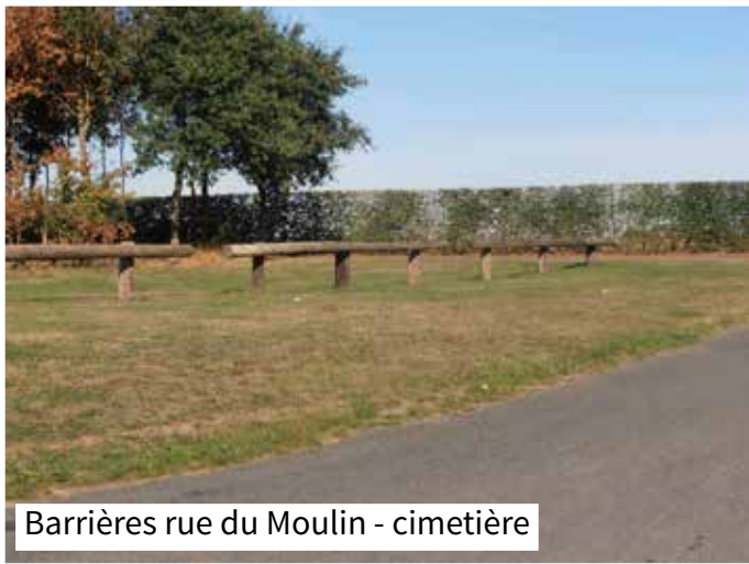
Barrières rue du Moulin - cimetière