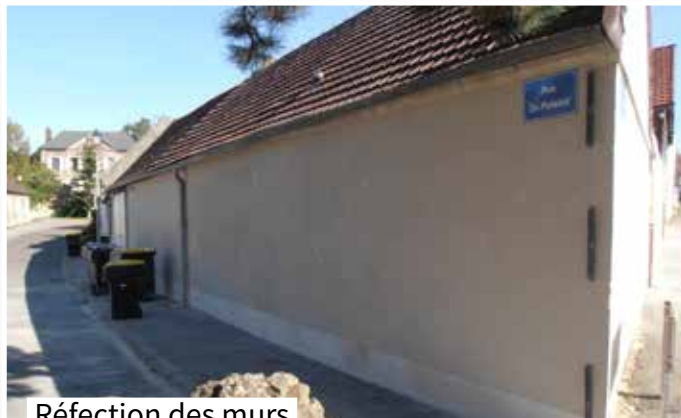
Réfection des murs des ateliers communaux