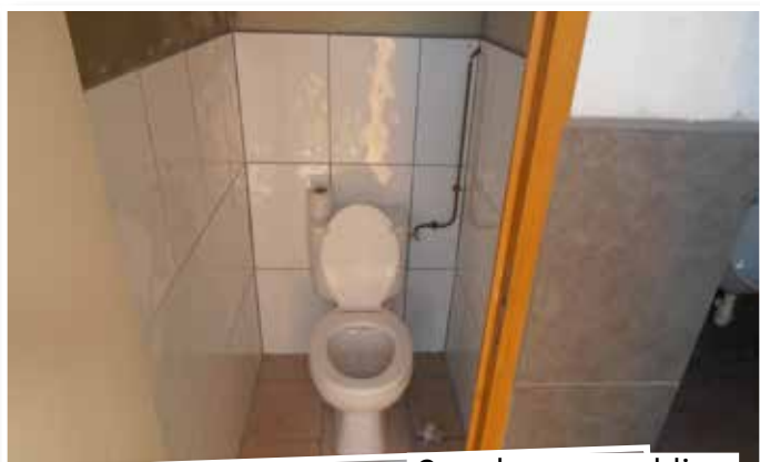
Carrelage wc public - stade municipal