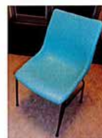
Possibilité de louer 59 chaises vertes

Prix : 5,00 € par table et 1,00 € par chaise