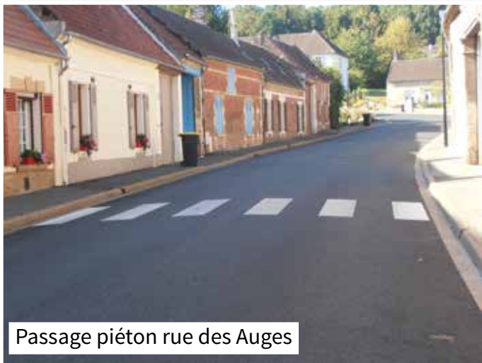
Passage piéton rue des Auges