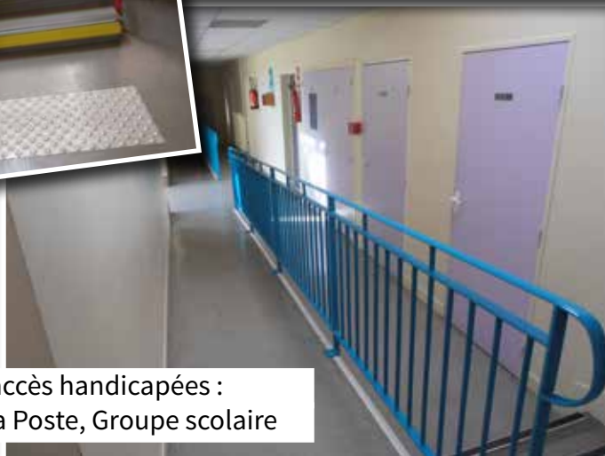
Mise aux normes accès handicapés : parking de la mairie, La Poste, Groupe scolaire