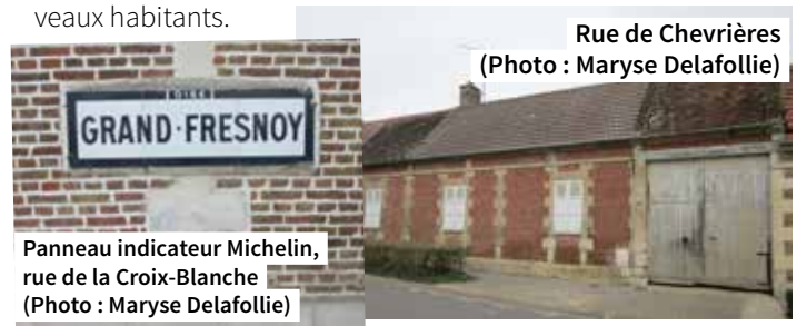
Rue de Chevrières

L'habitat traditionnel est constitué de fermes mitoyennes à cour fermée comportant sur la rue d'imposantes granges aux rares ouvertures et d'imposants porches charretiers. Comme les bâtiments, la maison proprement dite est construite en brique et pierre. De part et d'autre de pignons à redents, les toits à deux pentes sont couverts le plus souvent de petites tuiles ou de tuiles mécaniques. Toujours idéalement placée par rapport à la course du soleil, le logement se situe au fond de la cour où l'ensemble de la propriété peut être facilement surveillé. À l'arrière de celle-ci, on peut trouver un jardin potager et un verger. Naguère, il y avait des prés où pâturaient de paisibles vaches. Ces constructions originales édifiées au 19 e siècle dans un style sobre et élégant donnent une grande impression d'unité. À partir des années 1970, des zones pavillonnaires sont venues s'adjoindre à cet habitat ancien aujourd'hui très recherché des nouveaux habitants.