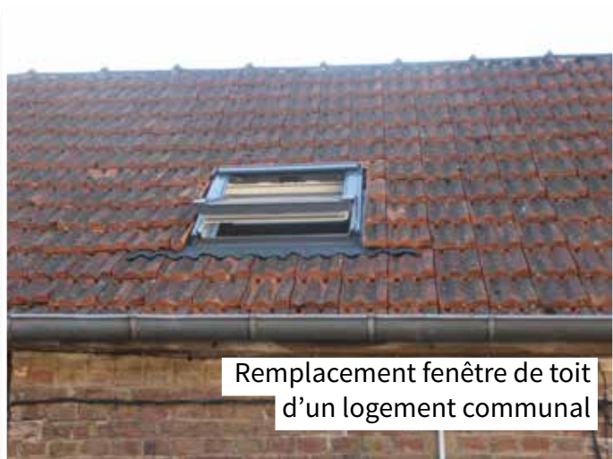
Remplacement fenêtre de toit d'un logement communal