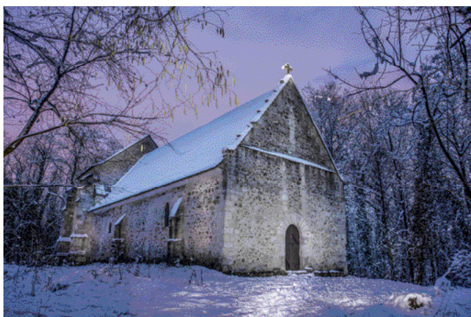
1 er prix : M.LECLERCQ Eric avec la photo de la chapelle