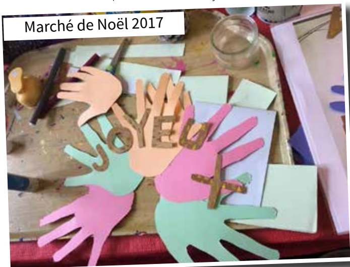
Marché de Noël 2017

Nous tenons à remercier tous les parents et les commerçants du village qui participent activement chaque année aux différentes manifestations et rendent ces dernières possibles et nous souhaitons la bienvenue aux nouveaux parents.