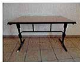
Possibilité de louer 15 tables Dimensions : Largeur 80cm, Longueur 120cm

Prix : 5,00 € par table et 1,00 € par chaise