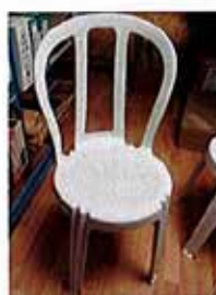
Possibilité de louer 10 chaises blanches